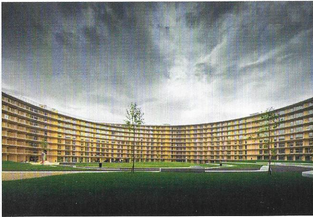
Nouveau temps fort pour Lausanne, p. 12